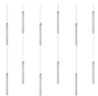
Kurtyna CURTAIN SF135MM